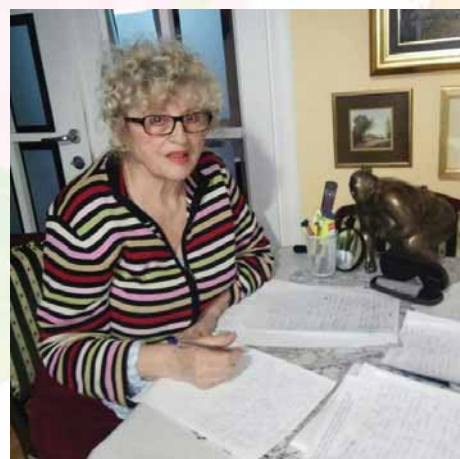
Фото: Божана Шимић, фото: Приватна архива

„То је било за филм, та сцена ме је непрестано пратила, нон-стоп сам је се присећала“, с видним емоцијама и надахнућем почиње причу Божана Шимић.