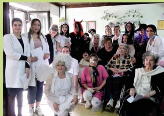
Организоване караоке и драмска представа у дому у Футогу