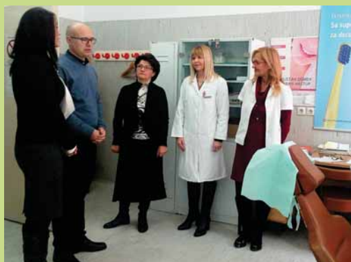
Градоначелник посетио Геронтолошки центар „Нови Сад“