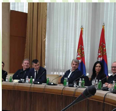
Конференција о међугенерациској солидарности у Палати „Србија“