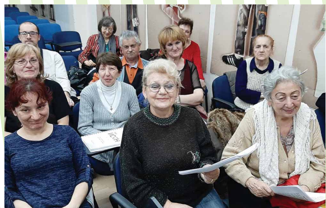
Корисници ГЦ „Нови Сад“ постали део инклузивног Хора „ИСОН“