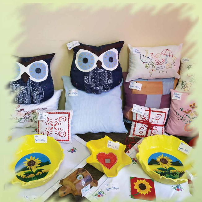
Изложба ручних радова у домовима