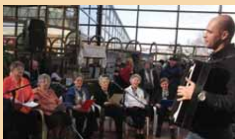
Основана музичка секција у дому на Лиману