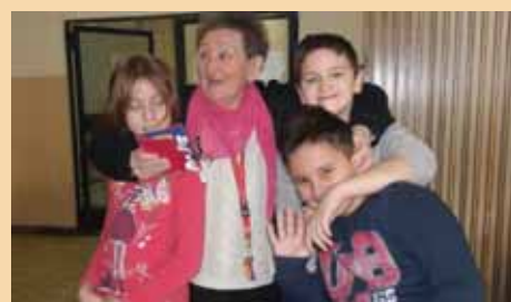
Неговање међугенерациске сарадње у ГЦ „Нови Сад“